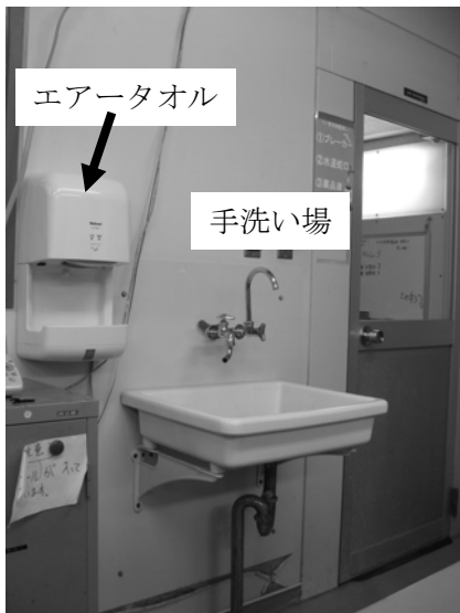
クリーンルーム内 手洗い場