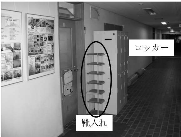
クリーンルーム入り口