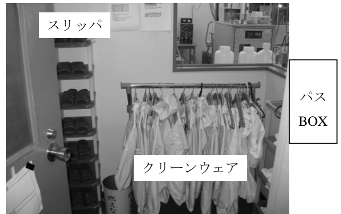
クリーンルーム前室

コートはロッカーに、靴は靴入れに入れて、クリーンルーム前室に入る。 クリーンルーム前室は狭いため、3人ずつで着替えを行う。